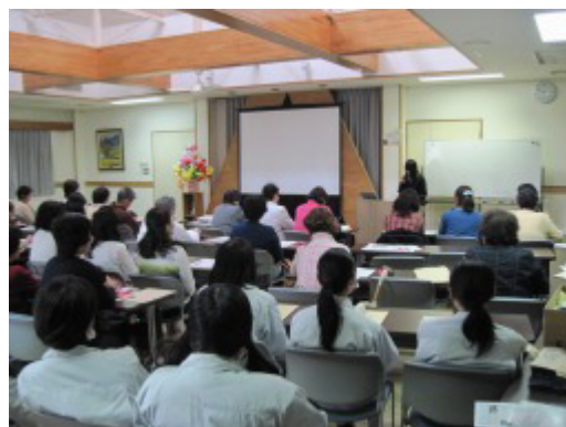
写真5 意見発表中の場内