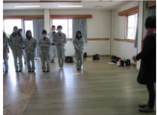
写真6 会場撤去後、グロッセ先生より