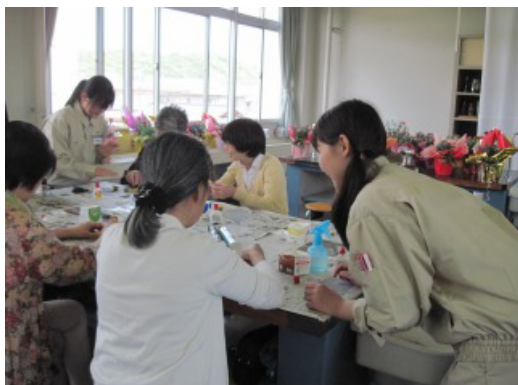
写真1 アドバイスする生徒