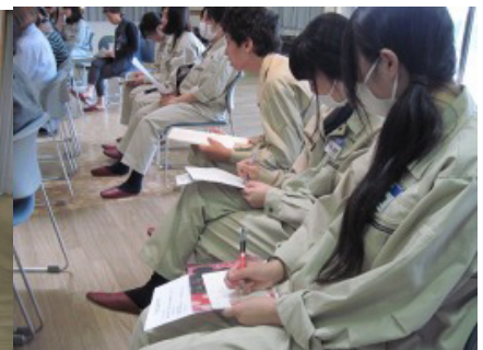
写真9 メモを取りながら学習