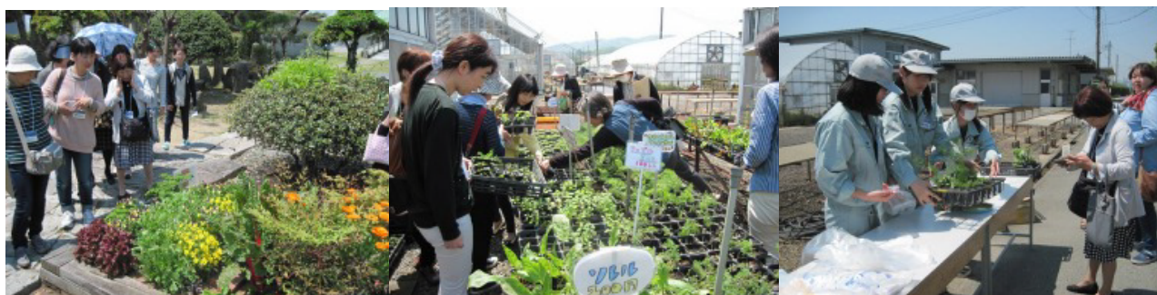
写真4 見学学習(花壇)