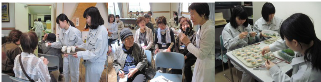
写真1 ウェルカムハーブティー

地域の外部講師の活用という企画でもあるが、満足感の高い学びの場であったと判断している。