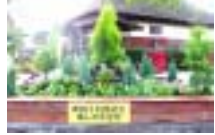
園芸セラピーによるガーデニング