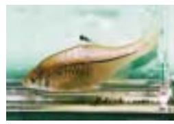
絶滅危惧種・スゲノニガコ